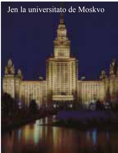
Jen la universitato de Moskvo

politikaj kaj ekonomiaj problemoj, subtenas la nunajn disvastigantajn movadojn, kiuj manifestacias diverslande kontraŭ tiaj internaciaj instancoj kiel Monda Banko, Internacia Mona Fonduso, Monda Organizo por Komercio, kies kunve-