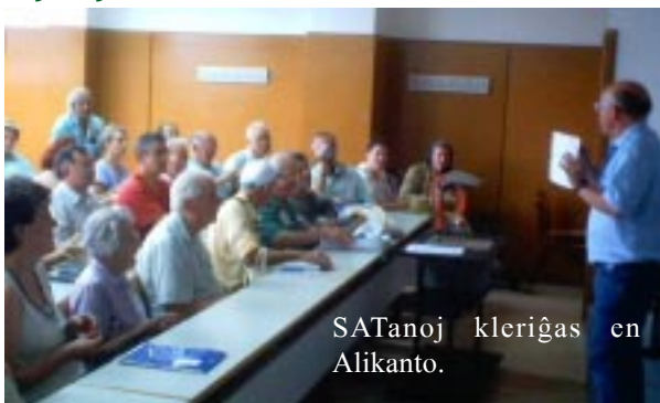
SATanoj kleriĝas en Alikanto.

Pro tio, ke mia sinteno ĉiam estis diskutanta, sed ne disputanta, mi honoras tiun peton, kaj mi renoncas al mia kutimo, prezenti al leganto de Kajeroj el la Sudo la citatan