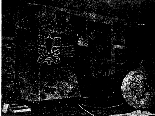
Vista de la interesantísima Exposición Esperantista organizada en Moyá ex- y muy diverso material expresamente recibido de todo el mundo

ando la preparación del Diccionario lo hecho hasta ahora, sobre esta a de tener, rogamos a todos los que Comisión encargada de este trabajo 13 - MOYÁ (Barcelona)