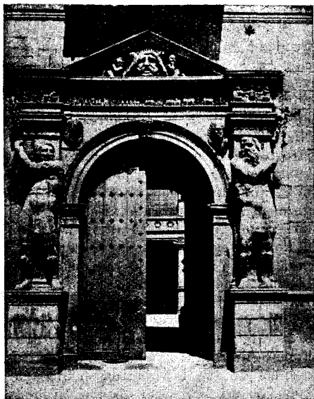
Palaco de la dukó Luna

El la nederlanda gazeto «Rivovo», Haarlem.