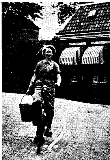
Juna nederlanda kamparanino.

Kaj ĉi tie kaj tie estis videblaj vilaĝetoj enhavantaj nur tre malmultajn domojn. Foje eĉ estis videblaj preĝejoj starantaj kun nur kvar au kvin domoj ĉirkaŭe. Ĉe la unua stacidomo nederlanda kie la trajno haltis, mi lernis la du unuajn vortojn en nederlanda lingvo: Koffie =kafo kaj Melk =lakto. Jen ni trairis Rotterdamon kaj ni povis konstati ankoraŭ la postsignojn de la terura milito. Tiu belega urbo estis senkompatate detruita! Hodiaŭ jam pluraj novkonstruitaj kvartaloj fieras pri laboremo kaj obstineco. En Hago mi forlasis la trajnon kune kun la simpatiaj nederlandaj gesinjoroj. Ili afable informigis pri la trajno kondukonta min al Haarlem. Mi devis atendi la trajnon en la sama perono kaj ĝi alvenis post 20 minutoj.