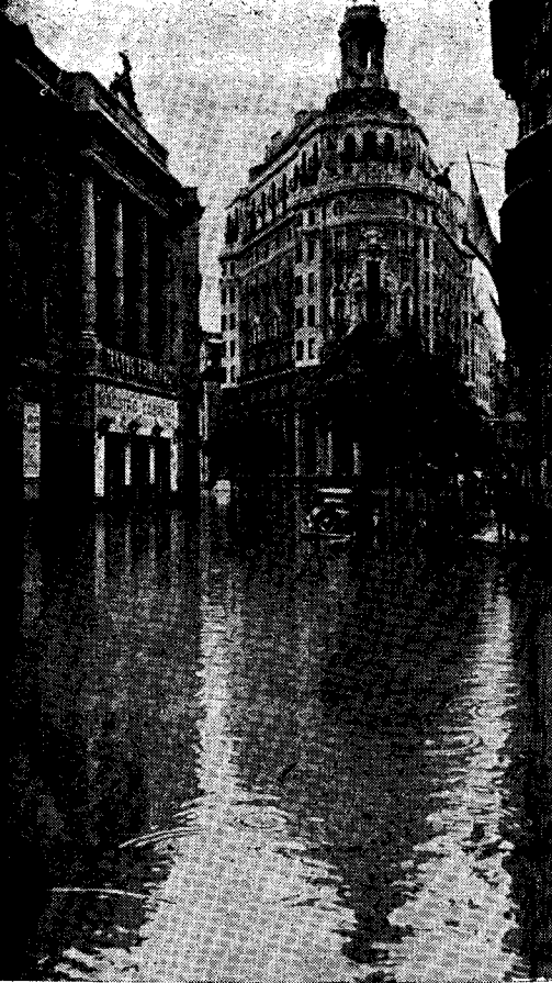
La Valencia Banko kaj la Ĉefa Teatro sin reflektas sur la akvon, kiu ĉi tie atingis, en sia kulmino, altecon de preskaŭ du metroj