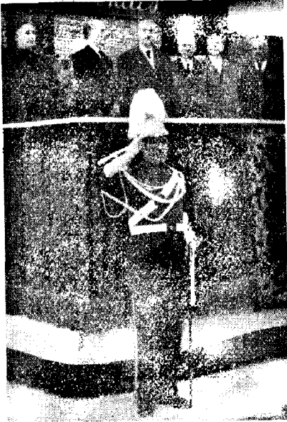
Apud la tribuno, kun aŭtoritatuloj, policanoj parade salutas la strofojn de nia himno.

KUN pli-malpli da garnituro , sed ĉiam digne, laŭ plej adekvata rango, nialanda samideanaro omagis, per eksterordinaraj aranĝoj, la memoron de nia Majstro, dum monato Decembro, ĉe la fina etapo de lia jubilea jaro. Prelegoj, gazetartikoloj, publikaj ceremonioj, festvesperoj, bankedoj aŭ simpla kunestado --eĉ en familia rondo-- tra la tuta amplekso de la hispana teritorio, estis kvazaŭ kirlaĵoj de flamanta fajro, transformita en simbolo de la hispana entuziasmo. Ĉar, en kelkaj el tiaj aranĝoj, mi reĝisoris aŭ rekte mem partoprenis, jen do ĉi-sube konciza kompilo, iom telegramstile, pri plej elstaraj punktoj, kiel adiaŭa saluto, en mia redaktora posteno: