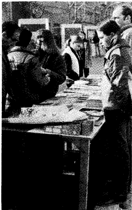
La publiko atente rigardas la librojn

En la plej centra parto de la Avenuo, barita por la trafiko, la Festo komenciĝis je la deka matene per senpaga disdonado de fandita ĉokolado al ĉiuj parto-