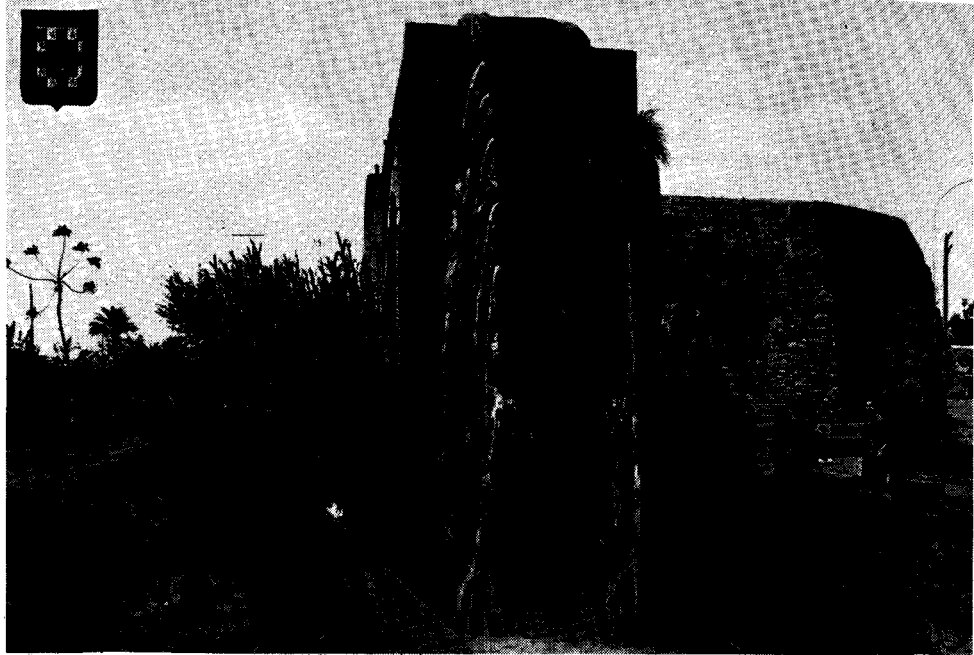
Rado de «La Ñora»

epidemia en la jaro 1885, kiu kaŭzis 7.000 viktimojn, estas la faktoj plej gravaj de la historio de Murcio dum la 19-a jarcento.