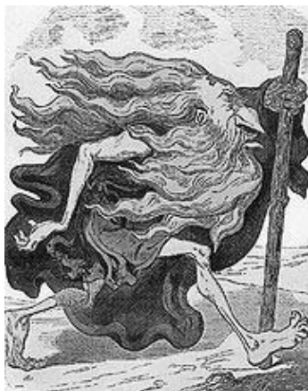
Sterotipa karikaturo G. Doré