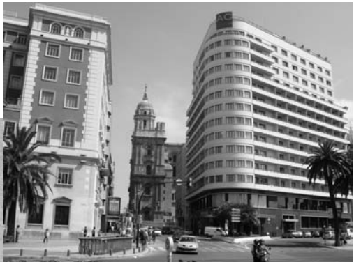
Malago hispana kongresurbo 2009