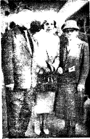
Familio Hilkersberger antaŭ la forveturo ĉe la stacidomo de Vieno

Je la 5-a de majo 1962 kune kun miaj edzino kaj filino mi ekvojaĝis al Budapeŝto por partopreni la 14-an Internacian ferojistan Esperanto-Kongreson. Alveninte la hungaran limstacion Hegyeshatom ni estis surprizitaj de la solenornamita stacidomo kun multaj esperantaj kaj hungaraj flagoj. Hungara ferojisto-esperantisto renkontis kaj akompanis nin ĝis Budapeŝto.