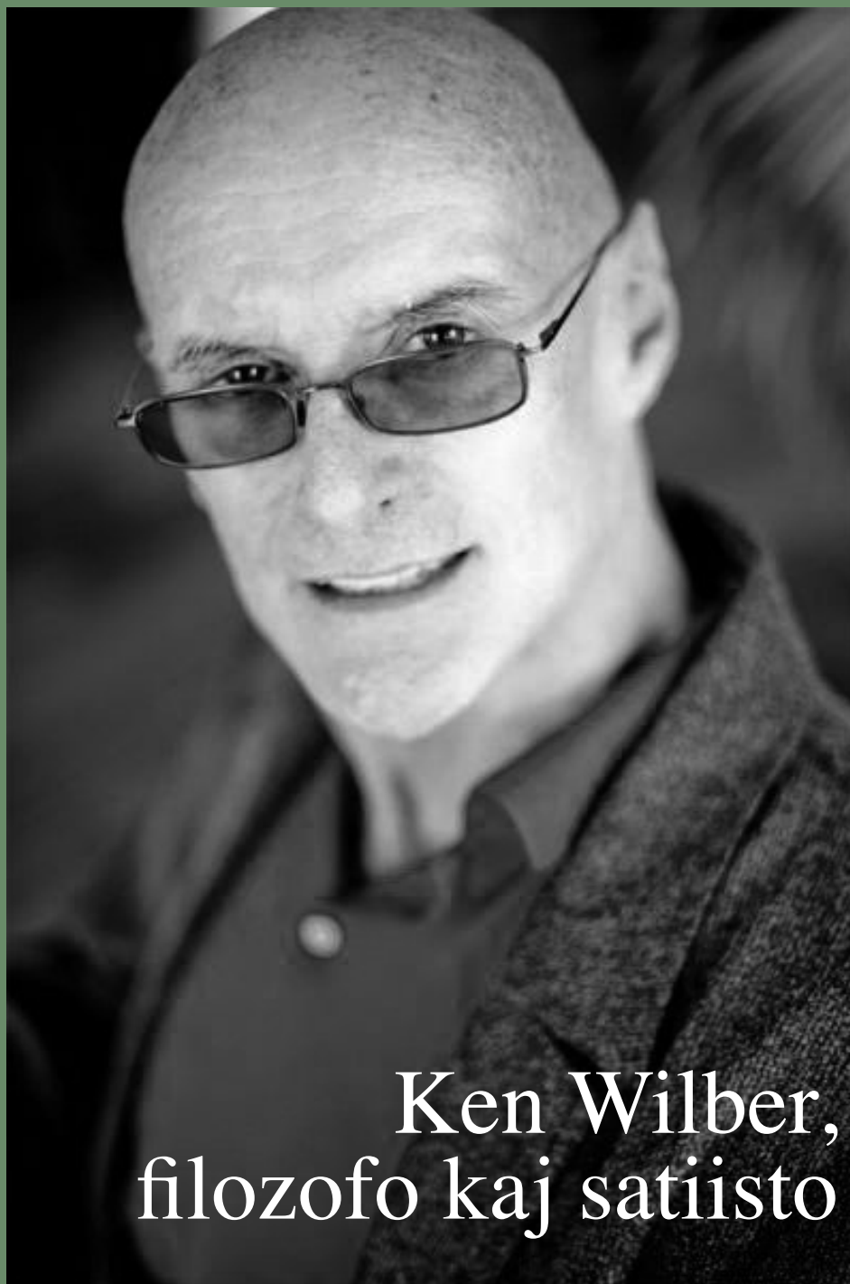
Ken Wilber, filozofo kaj satiisto